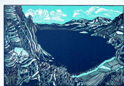
© Guillaume Guilpart, 2021 L'Echo du lac Linogravure en deux passages

À DÉCOUVRIR ÉGALEMENT à la bibliothèque universitaire Droit et Lettres du Campus de Saint-Martin-d'Hères , l'exposition des ouvrages des éditions Marchialy et des illustrations de couverture tirées à part en linogravure et réalisées par le graveur et typographe, Guillaume Guilpart. Du 12 septembre au 12 octobre 2022 Vernissage le mardi 13 septembre 2022 à 17h