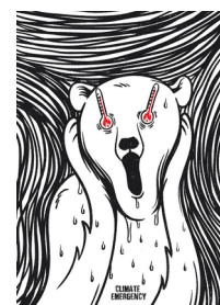
© Noordyanto Naufan, Indonésie Climate Emergency

Scénographes : Yann Moreaux, Emmanuel Mille