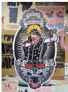
Patrona de las barricadas Marco Avalos 12/02/2020

Juan Francisco Rojas Henríquez , photographe et sa compagne Ellen Margot Rojas Fritz ont conservé par la photographie la mémoire de cette expression artistique composée d'affiches, de fresques murales, de graffitis et d'autocollants réalisés par des centaines d'auteurs, dont beaucoup sont anonymes, et qui attestent de la violence des affrontements dans l'espace public. Aujourd'hui, ces œuvres n'existent plus sur les murs.