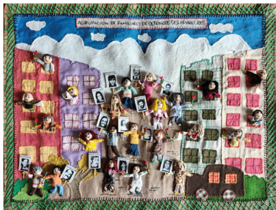
Agrupación de familiares de detenidos desaparecidos © Nivia Alarcon

L'exposition est accompagnée des Arpilleras de Nivia Alarcon qui transforme le mot en une expression brodée pour dénoncer, raconter et sauver ainsi la mémoire collective; des portraits des artistes et auteurs chiliens – Pablo Neruda, Violeta Parra, Víctor Jara, Gabriela Mistral – réalisés par le street-artiste Henri Beauregard connu sous le pseudonyme M4u ; et enrichie des œuvres d'artistes nationaux et internationaux, et de photographies d'archives des exilés chiliens en Isère.